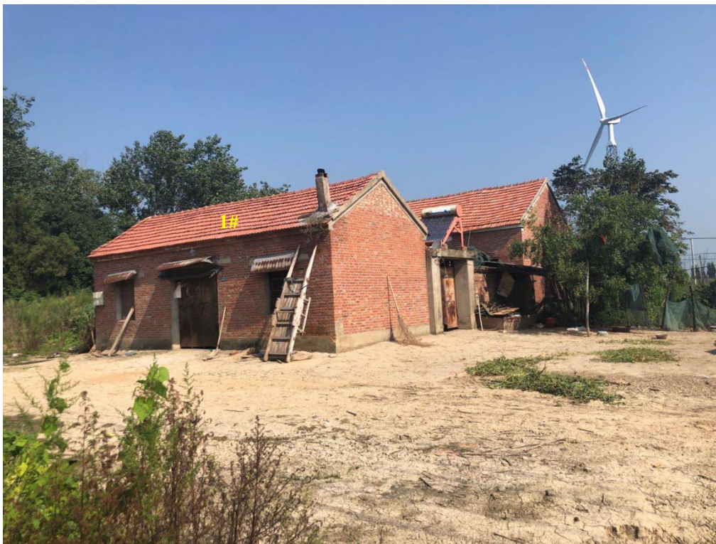
升压站北侧 58m 处 1#民房

生态保护红线规划的通知》（苏政发[2018]74号）进行生态调查； (11) 工程环境保护投资落实情况。