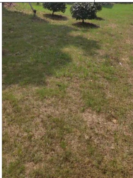
图 6-1 变电站周围绿化示意图