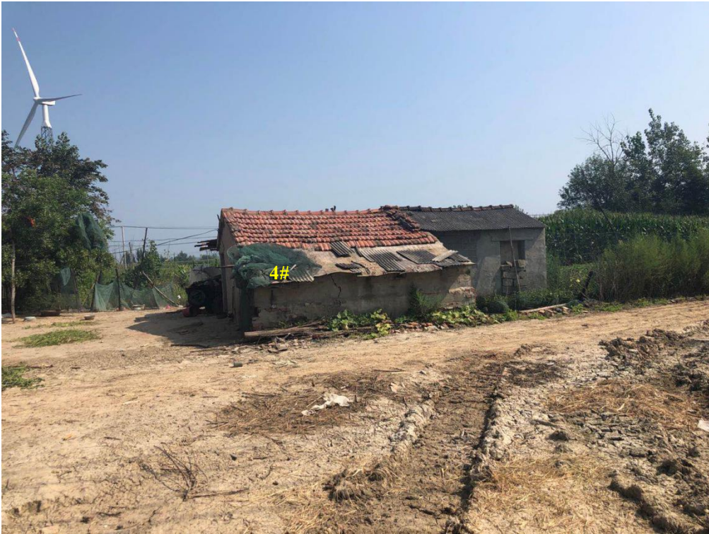
升压站东北侧 64m 处 4#民房