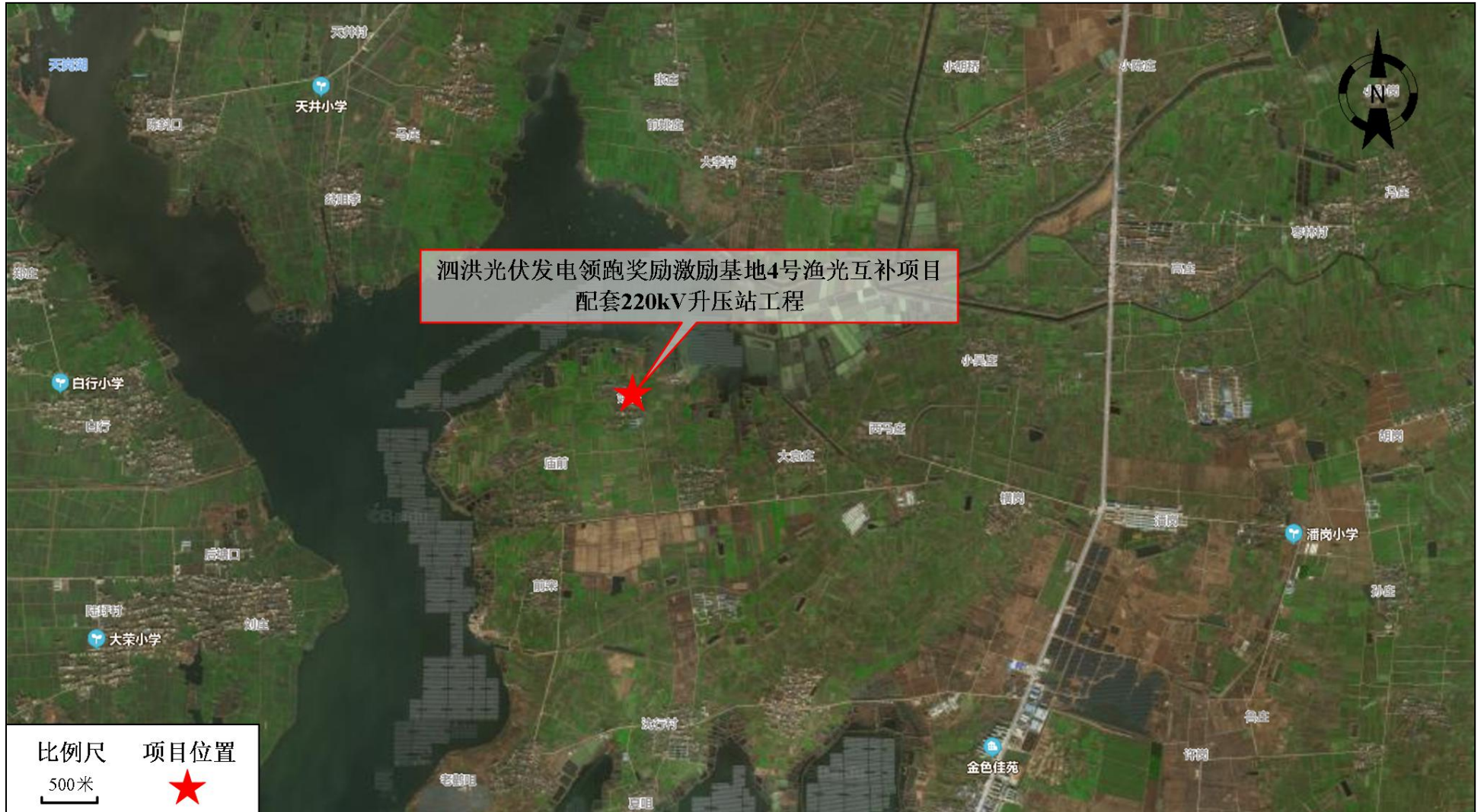
图 4-1 本工程升压站地理位置