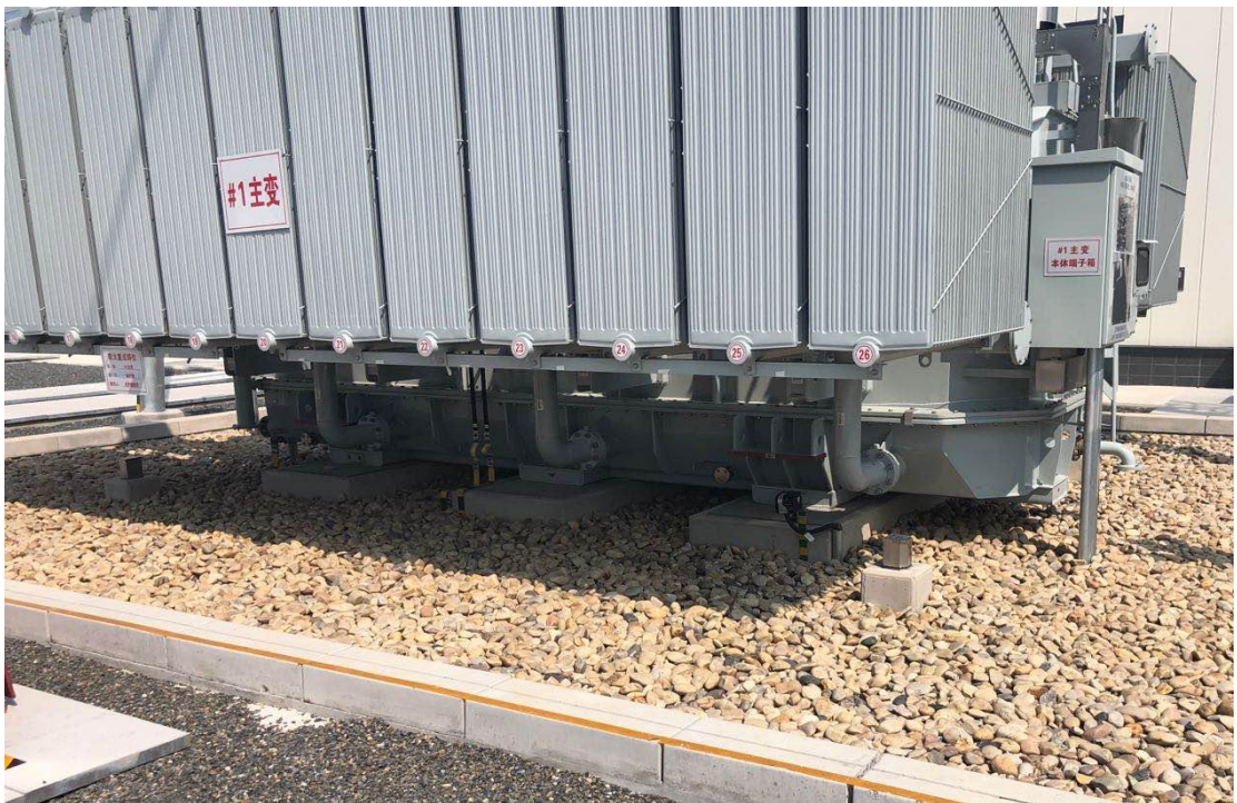
图 8-1 主变下方事故油坑