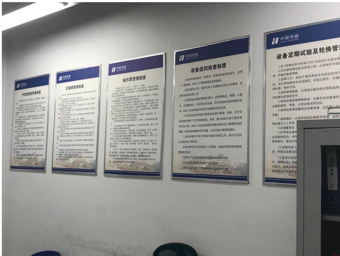
图 9-1 升压站值班室制度上墙

(3) 环保工作管理规范。本工程执行了环境影响评价制度及环保“三同时”管理制度。