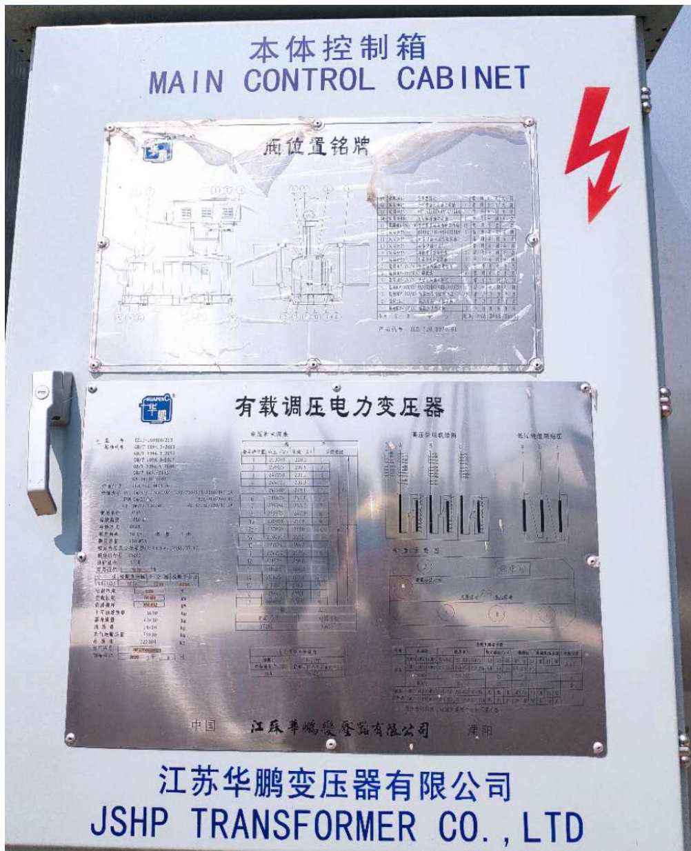
图 1-2 1#主变压器铭牌