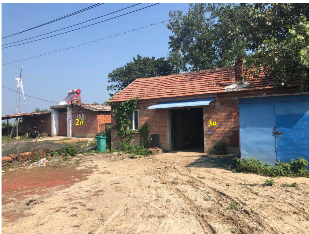
升压站东北侧 58m 处 2#、60m 处 3#民房